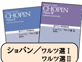
ショパン／ワルツ選 I ワルツ選 II