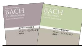
バッハ／インヴェンション シンフォニア

画期的な“チャート”の採用で難解な楽曲分析も ビジュアルで理解しやすい...アナリーゼ楽譜の 決定版！