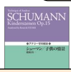
シューマン／子供の情景