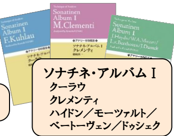
ソナチネ・アルバム I クラウ クレメンティ ハイドン／モーツァルト/ ベートーヴェン／ドゥシェク