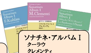
ソナチネ・アルバム I クーラウ クレメンティ ハイドン／モーツァルト/ ベートーヴェン／ドゥシェク