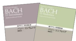
バッハ／インヴェンション シンフォニア

画期的な“チャート”の採用で難解な楽曲分析も ビジュアルで理解しやすい...アナリーゼ楽譜の 決定版！