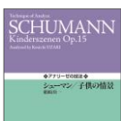
シューマン／子供の情景