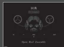
回典~En-Cyclepedia~ (DVD付) 定価:2,400円(税込)

旧式のオープンリールデッキと現代のコンピュータを融合させて、「楽器」として演奏するプロジェクト Open Reel Ensembleが初の書籍『回典』を刊行しました。巻頭では、リーダーの若き天才音楽家の和田永氏と、現代の“知の巨人”松岡正剛氏のスペシャル対談が実現。一音楽界におとずれた急速なデジタル化は、私たちがこれまで感じていた音と感情の関係性にも変化をもたらしました。失われゆくアナログの中にある、何か。それは人間のプリミティブな欲求を満たす、ざらついた、たしかに手触りのようなもの。録音と再生、音と感情、生命、そして宇宙に至るまで、この二人だからこそ生まれたエキサイティングな内容は必見です。録音メディアの歴史を辿りながら、様々な豪華ゲストと対談していく第一章、オープンリールアンサンブルを徹底解剖する第二章、まだ見ぬ未来の可能性を探った第三章。付録のDVDには、彼らの今作限りのプロジェクト Open Reel Orchestra を映像化したドキュメント+ライブを収録。超一流の豪華スタッフ陣で制作したライブ映像は圧巻です。(さ)