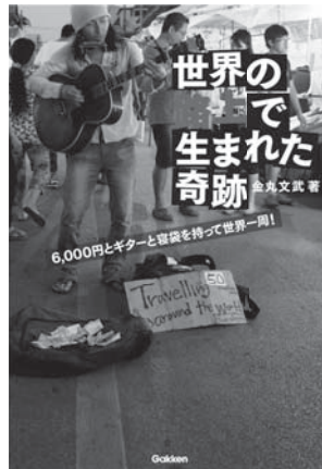
■四六判/304頁/本体価格 1,300円(税別)

1981年生まれ、宮崎県出身。14歳からギターを始め、16歳から九州で路上ライブを開始。20歳のときに日本一周の旅に出発し、4年半で完了。日本一周の旅を一冊にまとめた紀行本『青春の放浪』を自費出版し、手売りのみで販売。30歳を機に世界へ飛び立ち、2年4ヶ月かけて世界一周完了。世界一周の様子を綴ったブログのアクセス数は毎日3万を超える人気に。2015年7月、初の全国流通となるミニアルバム『アンダルシアの風』をリリース。