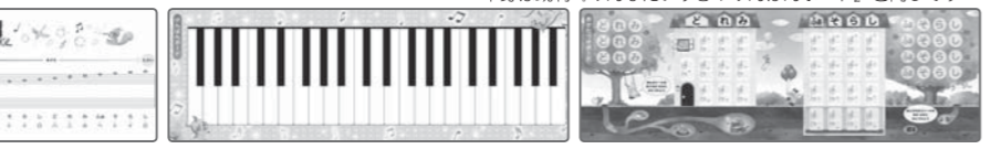
■207×630mm (けんぱんボードのサイズ) / 本体価格1,400円 (税別)

「おとのなまえピース」「おんぷピース」の素材をボードに貼ってはがせるシールにリニューアル。「おとのなまえシール」「おんぷシール」として生まれ変わりました。これまでのピースよりもはがれにくい素材を使用しています!