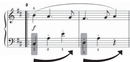
腕の重みを徐々に抜いていく

第②部の左手は、音程が広い弾きにくいと思います。まず、それぞれの音をよく指を動かしながら弾いて、鍵盤が下がる感触を指で十分に確かめてみてください。次に、腕の重みもかけてそれぞれの音を弾きます。鍵盤ごとに腕が安定する位置を探り、慣れてきたらレガートにします。指が届かなくてもレガートを意識しましょう。最後に、レガートの腕の動きをペースにしながら指で音を短くします。腕の重みはC#音とD音に最もかけて、徐々に抜いていきます。