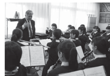
▲実際の部員たちの様子や練習風景などの写真もたっぷり掲載 (写真は羽村一中) ■A5判/164頁/本体価格1,000円(税別)

『きばれ! 長崎ブラバンガールズ』、『吹部ノート』、『みんなのあるある吹奏楽』シリーズの著者が中学吹奏楽部員に贈る、強豪校の部活の実態を紹介する吹部訪問、オザワ部長と名指導者や有名人との対談、演奏会やコンクールレポートなど、日々の吹部活動に役立つ一冊。