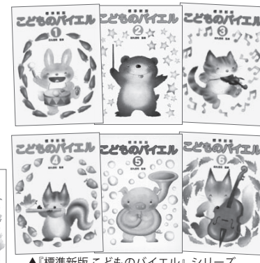
▲『標準新版 こどものバイエル』シリーズ