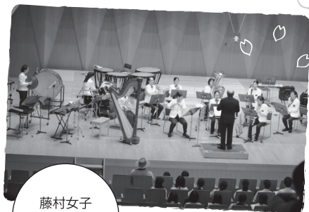
藤村女子中学・高等学校 (東京都)