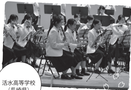
活水高等学校 (長崎県)

《サヨナラノオト ブラバンガールズの約束》発売中 ■四六判/244頁/本体価格1,300円(税別)