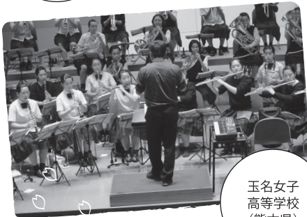
玉名女子高等学校 (熊本県)