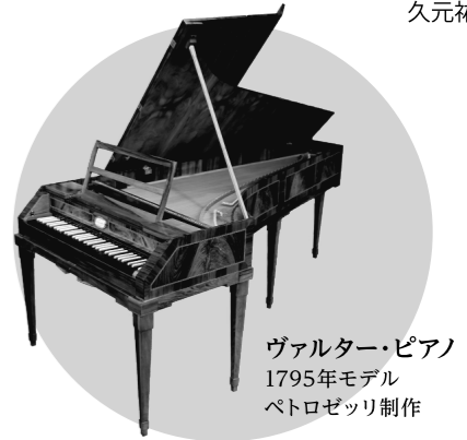
ヴァルター・ピアノ 1795年モデル ペトロゼリ制作