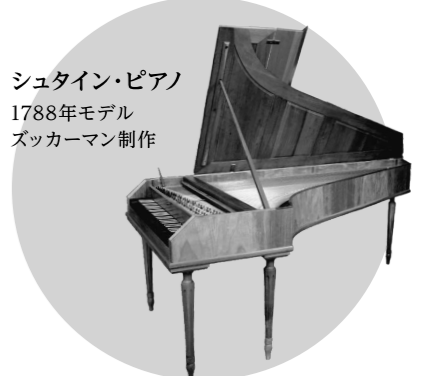
シュタイン・ピアノ 1788年モデル ズッカーマン制作