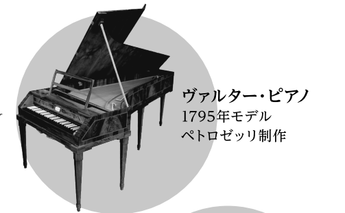
ヴァルター・ピアノ 1795年モデル ペトロゼッリ制作

モーツァルトお気に入りのピアノフォルテには、アンドレアス・シュタイン制作のものと、アントン・ヴァルター制作のものがあります。現代の制作者の手で復刻されたものではありますが、この2台が初秋の五反田に登場します! 実際の音を聴いてみると、モーツァルト作品の軽やかさ、硬質な輝きをより深く理解できると思います。モーツァルトが愛したピアノフォルテの響きを愉しめる貴重な機会、ぜひお運びください!(か)