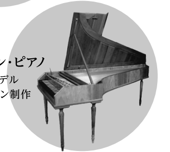
シュタイン・ピアノ 1788年モデル ズッカーマン制作