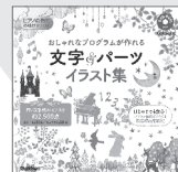
■ピアノの先生お助けBOOK おしゃれなプログラムが作れる文字&パーツイラスト集 本体価格1,500円(税別)学研プラス刊

秋の発表会プログラム作りは、お助けアイテム「おしゃれなプログラムが作れる文字&パーツイラスト集」で決まり！プログラム作りにもってこいの背景イラストや、あたたかみのある文字イラストなどの素材が満載です。少し手間なプログラム作りが、楽しい時間になること間違いなし！