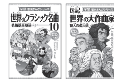
■学研 音楽まんがシリーズ 世界のクラシック名曲10(CD付き) 本体価格1,600円(税別)学研プラス刊 ■学研 音楽まんがシリーズ 伝記 世界の大作曲家(CD付き) 本体価格1,600円(税別)学研プラス刊 ■小学館学習まんがシリーズ 名探偵コナン推理ファイル 音楽の謎 本体価格900円(税別)小学館刊

夏休みはお友だちと遊んだり、家族や親戚で旅行に行ったりと、ピアノと離れた生活を送りがちになりますよね。楽しく音楽に触れてもらうために、生徒さんに音楽まんがをおすすめしてみたいかがでしょうか？まずは「学研 音楽まんがシリーズ」(小社刊)。さまざまな作曲家や名曲ができるまでの背景を、サクッと楽しく学ぶことができます。大人が読んでも楽しい「小学館学習まんがシリーズ 名探偵コナン推理ファイル 音楽の謎」(小学館刊)もおすすめ！まんがの面白さもさることながら、音楽の知識もたっぷりと分かりやすく解説されていて、読みごたえありの1冊です！